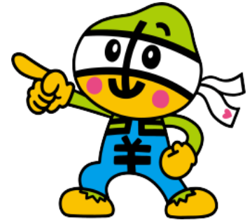
コミュニティ・スクールなかのせき イメージキャラ なつかー

さて、3年間ほど続いた新型コロナウイルス感染症の流行が、ようやく収束に向かいつつあります。4月からは、マスクの着用を求めないことを基本とはいたしますが、今後も十分な換気などの必要な対策を行い、子どもたちの安全に配慮しながら教育活動を進めてまいります。また、今年度は開校150周年を迎えます。この機会に、150年の歴史を振り返ったり、地域とのつながりをより深めたりすることとおして、「ふるさとを愛し、ふるさとに誇りをもつ子どもたち」を育成していきます。